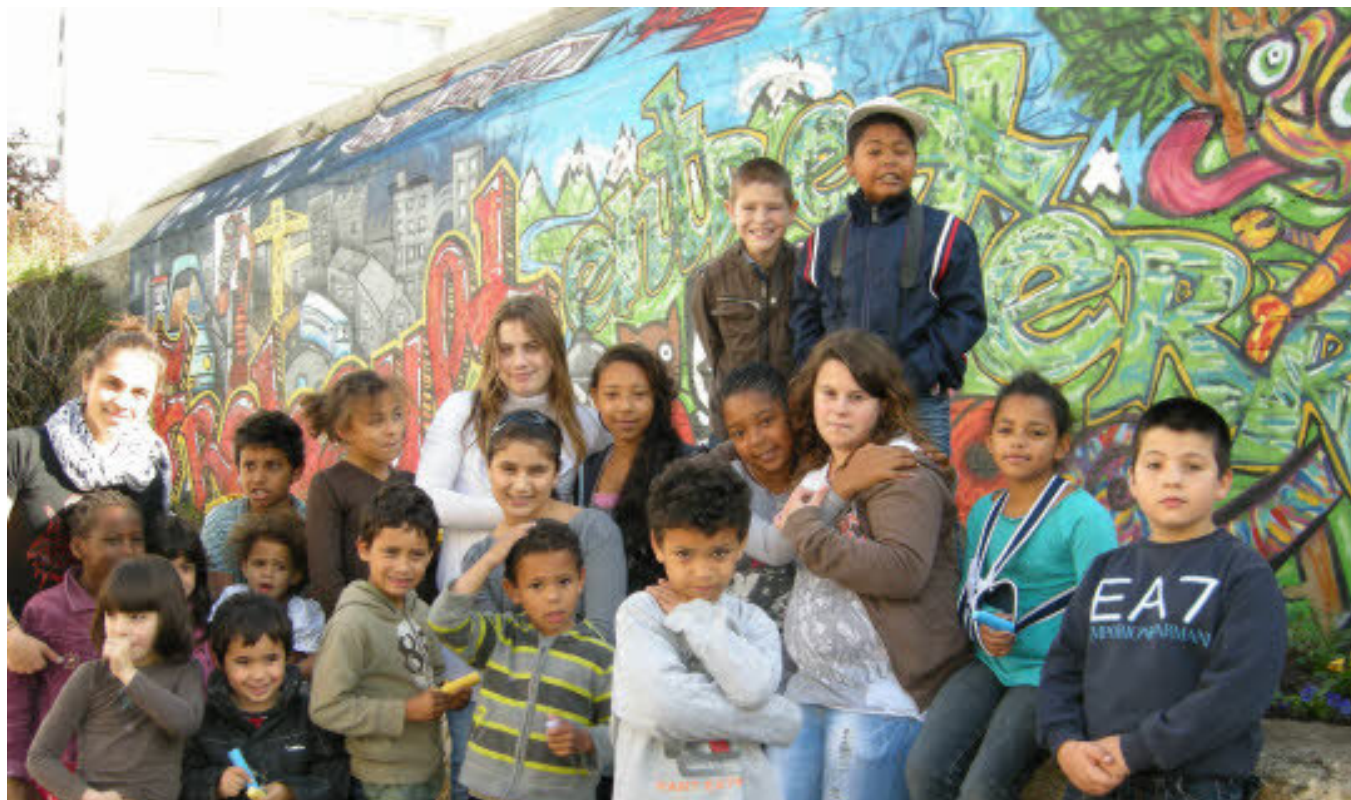
Les enfants fiers de cette fresque qui donne de la couleur au quartier et au blockhaus.

La rue Frébault était en fête samedi après-midi. Le centre social avait tenu à marquer l'aboutissement du projet de fresque sur le blockhaus, par un moment officiel et festif. Toutes les générations s'y sont retrouvées. La couleur, tel était le maître mot des demandes des habitants lors des réunions de quartier. Les plus jeunes parlaient peinture, les plus anciens, fleurs. Les deux sont désormais réunis dans une belle réalisation.