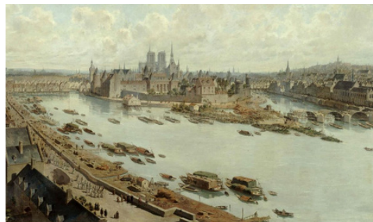
Vue panoramique de la Seine en 1588 par Théodore-Josef-Herbert, depuis les toits de Paris.

"Dans la Seine": une exposition dévoile les objets retrouvés dans le fleuve parisien